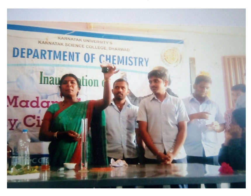
Extension Progrmme at Mansur 2015