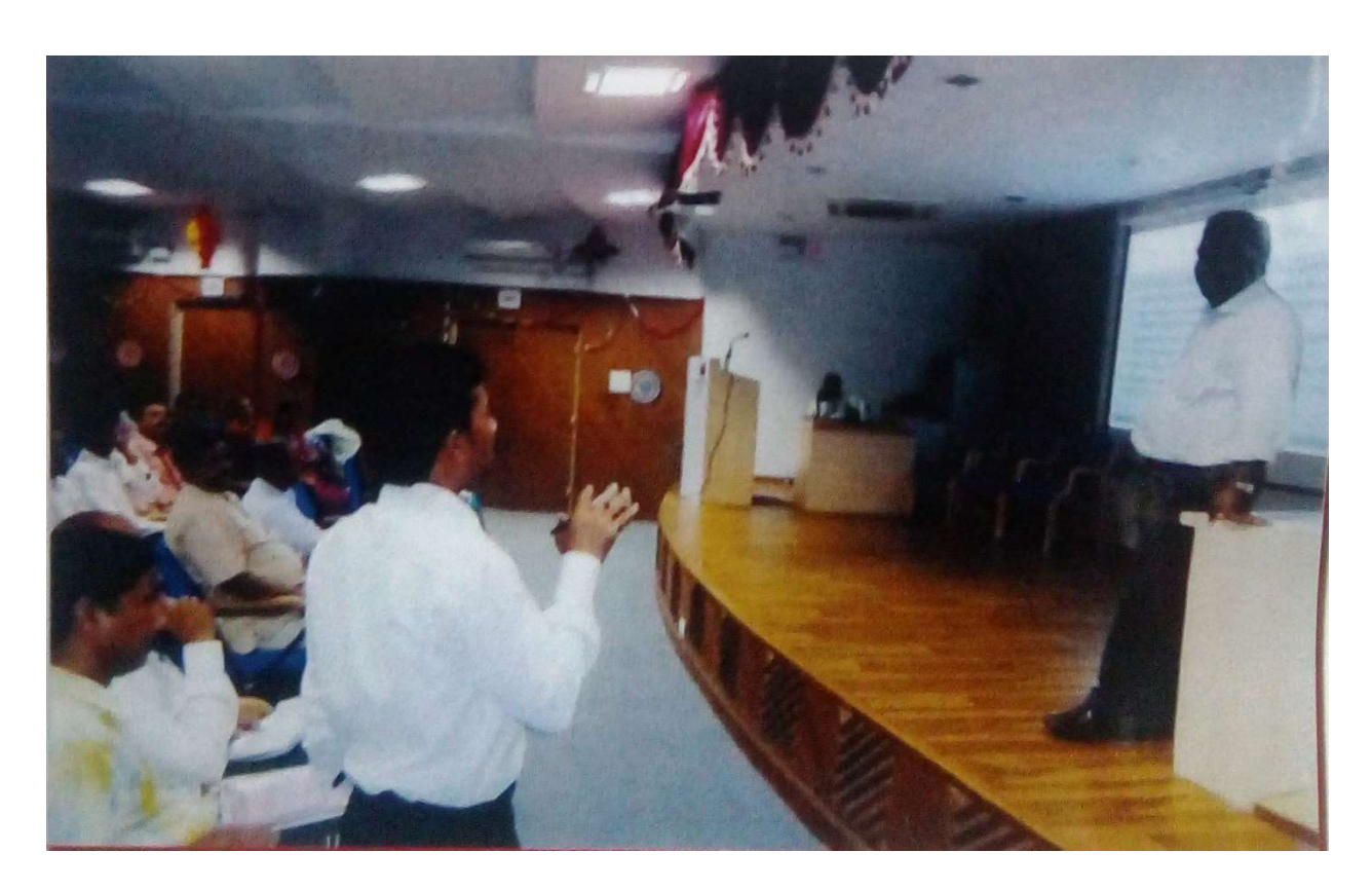
Teachers Workshop 2