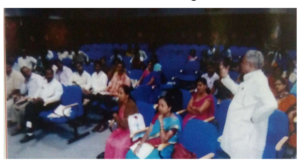
Teachers Training 2