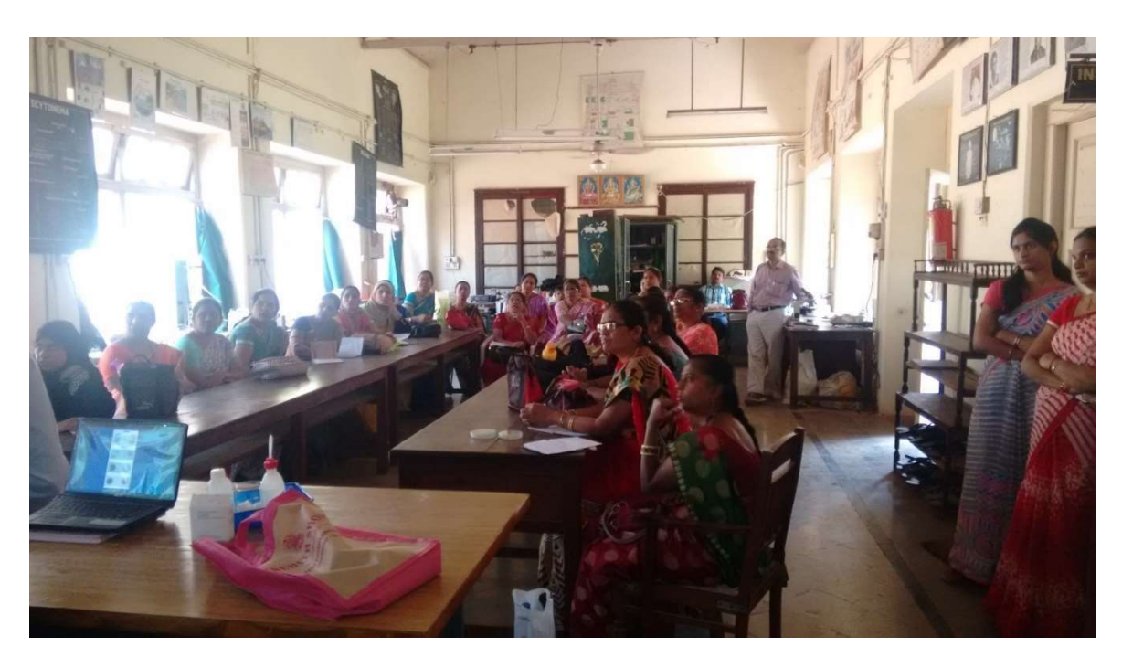
Teacher training programme (2)