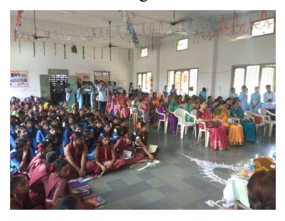
Extension programme 2018