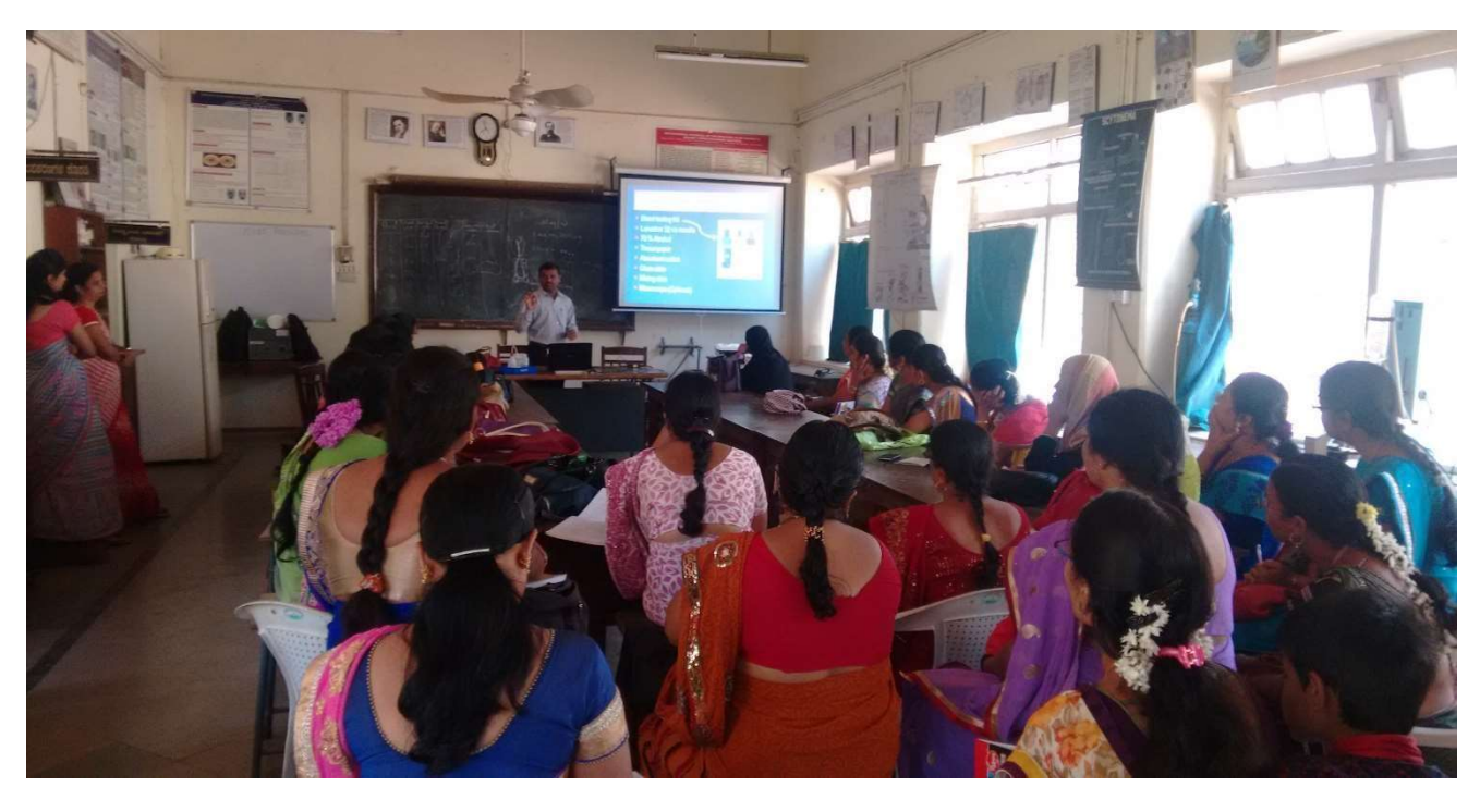
Teacher training programme (2)