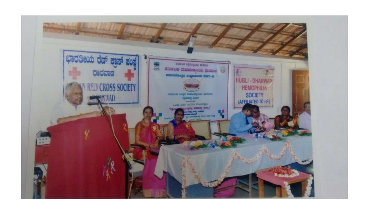
Extension Programme 2015